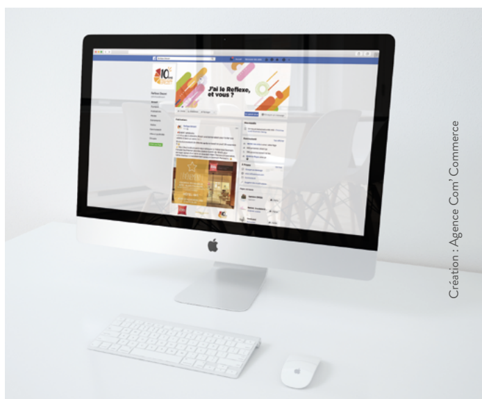
Création : Agence Com' Commerce

Inscriptions : http://www.reflexebrezet.com/adherents/submit.php